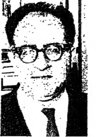
السيد خيليب حبيب الجنوبية من المساعدة الامريكية اكثر من 200 مليون دولار من المساعدة الاضافية التي طلبها الرئيس الامريكي نورد من الكونغرس . وقال ان المسئلة التي يتوجب على

قال مساعد وزير الخارجية الامريكي لشؤون اسيا السيد خيليب حبيب ، وهو لبرنامج اصيل ، ان خمس او ست فرق من اصل فيتنامي فرق احتياط فيتنامية شمالية ، قد زج بها في الحركة في فيتنام الجنوبية . واصف : ان وقت اصبح حوالي ثلثي البلاد تحت السيطرة الشيوعية ، فان الاختيار بالنسبة الى الفيتناميين الجنوبيين هو تحطيم « استقرار الوضع » في المنطقة العسكرية الشمالية الغربية . وقال ان القوات سيكون واضحا على الارض . دفاع الفيتناميين الثالث والرابع وكذلك المنطقة الحبيطة بسيفون ، سيكون صلب القوية . وقال السيد حبيب انه لا يستطيع التحدث عن وضع الحركة ، وذلك بسبب موضع الاختيار ، وهو امر على الفيتناميين الجنوبيين ان يحددهم بطقهم وروحهم . وتوقع بان تكون مطالبات فيتنام